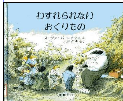
わすれられない おくりもの

毎月おすすめの絵本を掲載します。親子で読書はいかがですか。学校の図書室や最寄の図書館で探してみてくださいね。